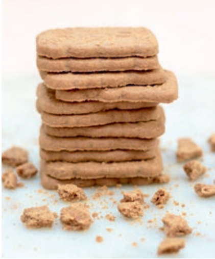
Speculaasjes € 5,10