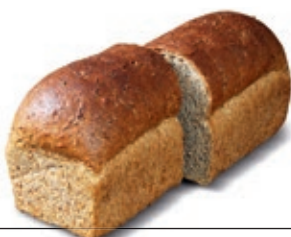
Grof volkoren € 3,80 nu € 3,50 (14 t/m 26 oktober)