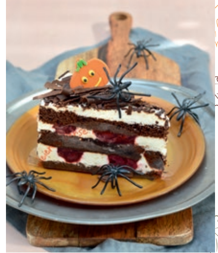
Schwarzwaldkirsch € 3,10