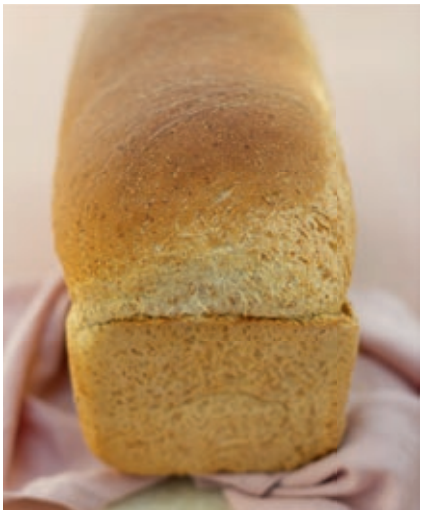
Lichtbruin € 3,60 nu € 3,30 (28 oktober t/m 9 november)