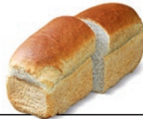
Lichtbruin € 3,60 nu € 3,30 (28 oktober t/m 9 november)