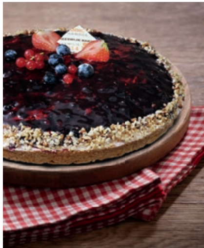
Bosvruchtenbavaroise € 21,90 nu € 18,00