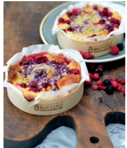
Bosvruchtententje € 3,10 nu € 2,95