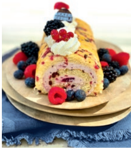
Roll it bosvruchten € 11,95 nu € 9,95