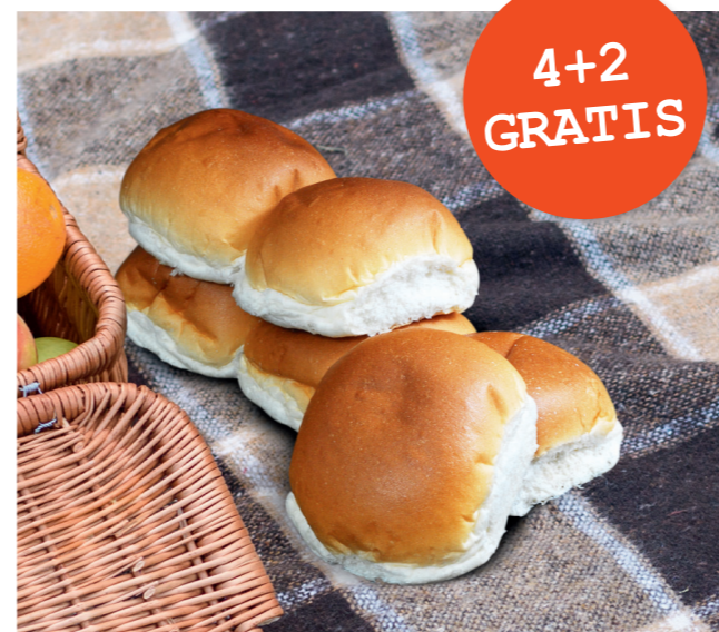
Broodje rond, 6 stuks € 3,60 nu € 2,40