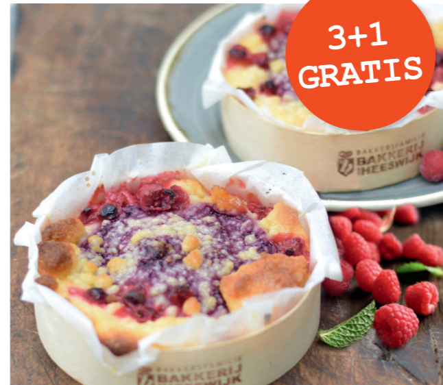
Frambozenteutje € 3,25 nu € 2,90