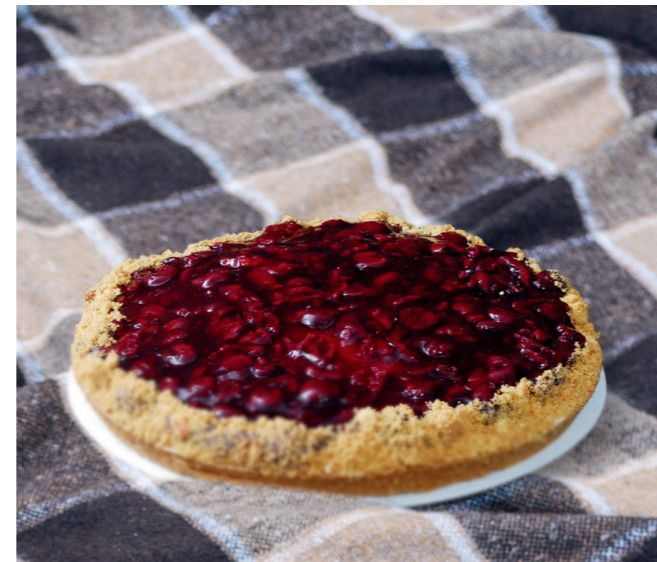
Kersenmonchouvlaai € 23,25 nu € 20