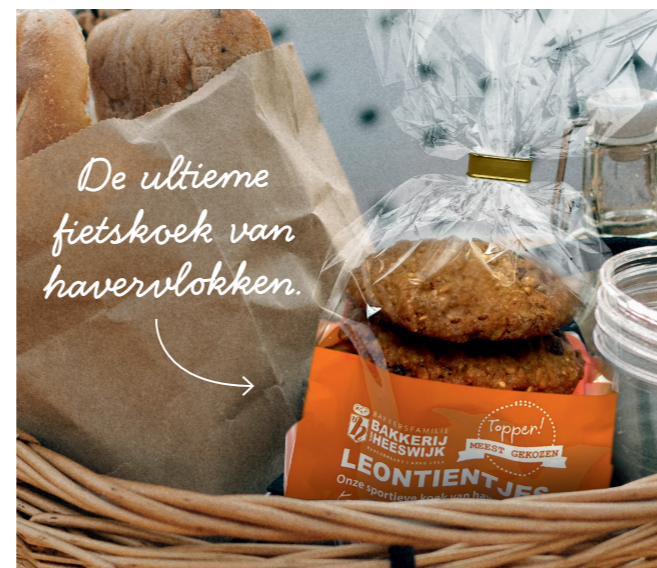
Loentientje, 5 stuks € 5,70 nu € 4,95