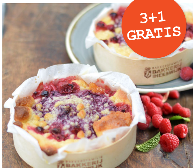
Frambozenteutje € 3,25 nu € 2,90