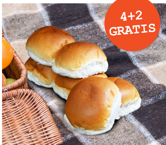
Broodje rond, 6 stuks € 3,60 nu € 2,40