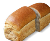
Busbruin € 3,40 nu € 3,10 (3 t/m 22 augustus)