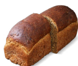
Dommels donker € 4,30 nu € 4,00 (29 juni t/m 11 juli)