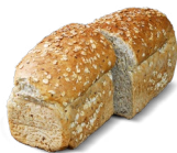
Gessels granen € 4,30 nu € 4,00 (13 juli t/m 1 augustus)