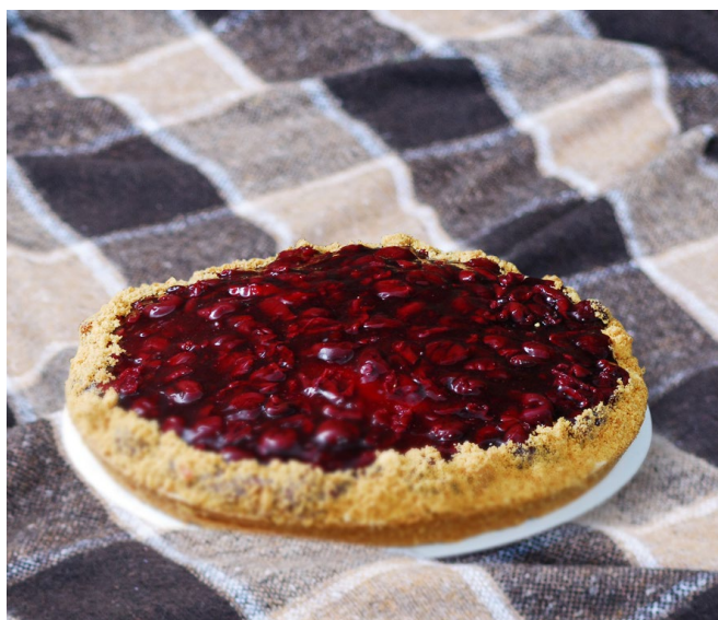
Kersenmonchouvlaai € 23,25 nu € 20