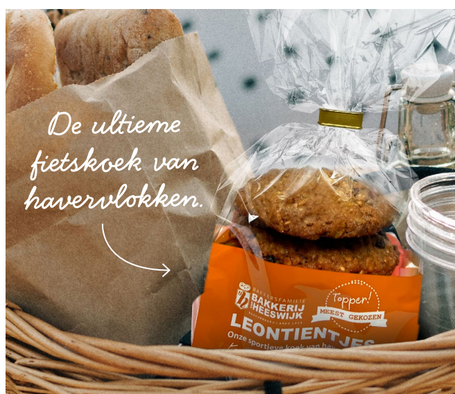
Leontientje, 5 stuks € 5,70 nu € 4,95